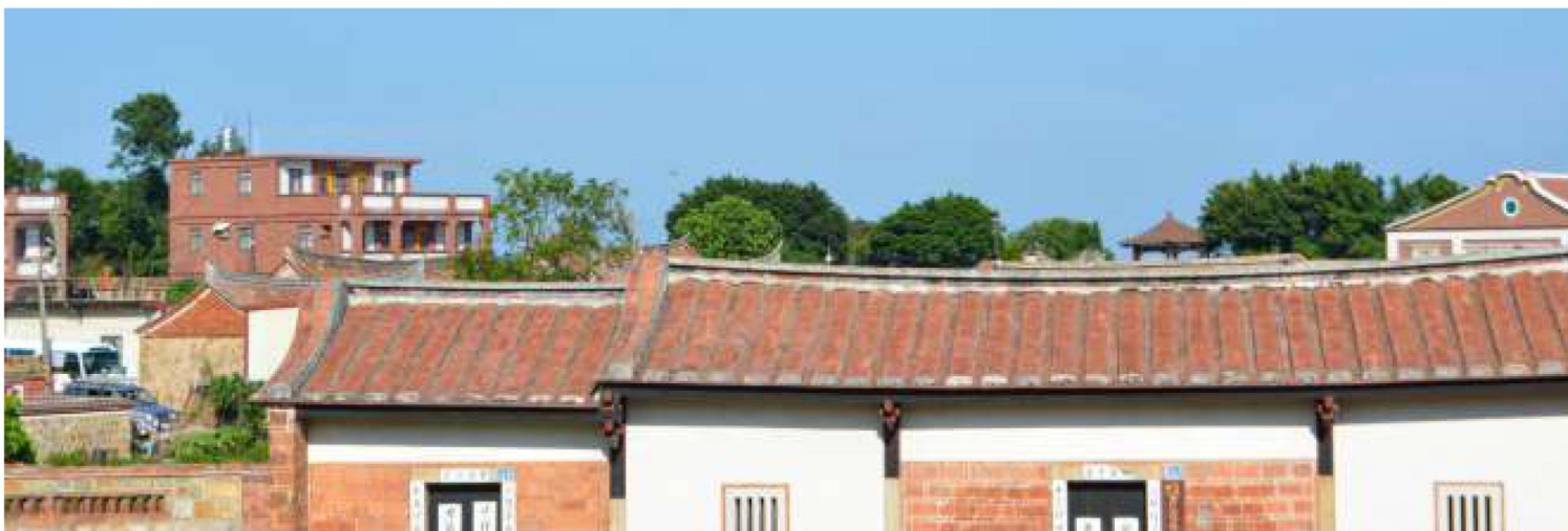
北山古厝樓 背包客棧